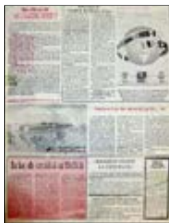
Ziarul Di Nuovo Insieme , numărul unu