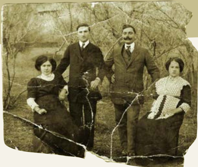
Album de familie

E ottiene che nell'anno 1993, con l'approvazione del Ministero dell'Istruzione e dell'Ispettorato giurisdizionale della Tulcea, si apra il corso rispettivo, con un numero di