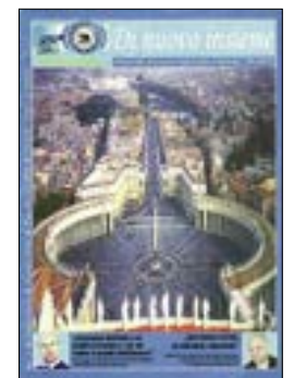
Primul număr al revistei Di Nuovo Insieme

Victor Partan în calitatea sa de redactor-șef al ziarului Piazza Romana , a făcut un scurt istoric al acestei publicații lunare în care sunt prezentate cu