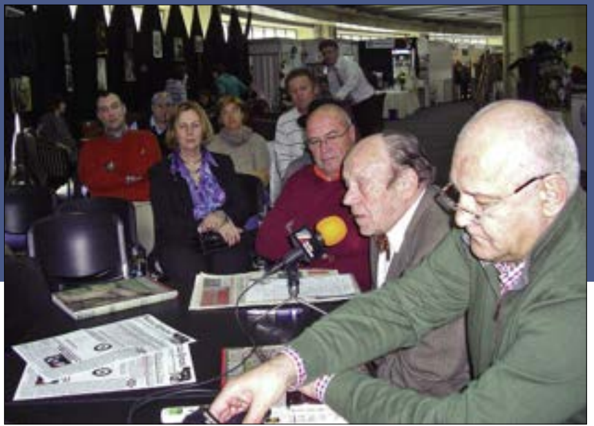
Aspect de la masa rotundă