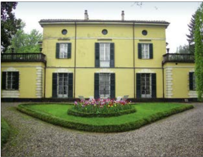
Sant'Agata – vila lui Giuseppe Verdi

Gemito, lucrat la Neapole în 1872, când Verdi avea 59 de ani, în timp ce sculptorul, numai 19. În sfârșit, într-o vitrină din fața șemineului sunt păstrate mănușile albe pe care Verdi le-a purtat o singură dată, pentru a dirija premiera lucrării Messa da Requiem pe 22 mai 1874, în biserica San Marco din Milano, cu ocazia comemorării unui an de la moartea lui Alessandro Manzoni.