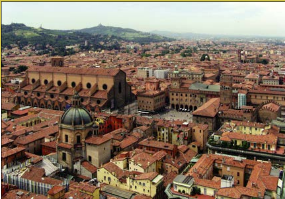
Bologna – panorama orașului