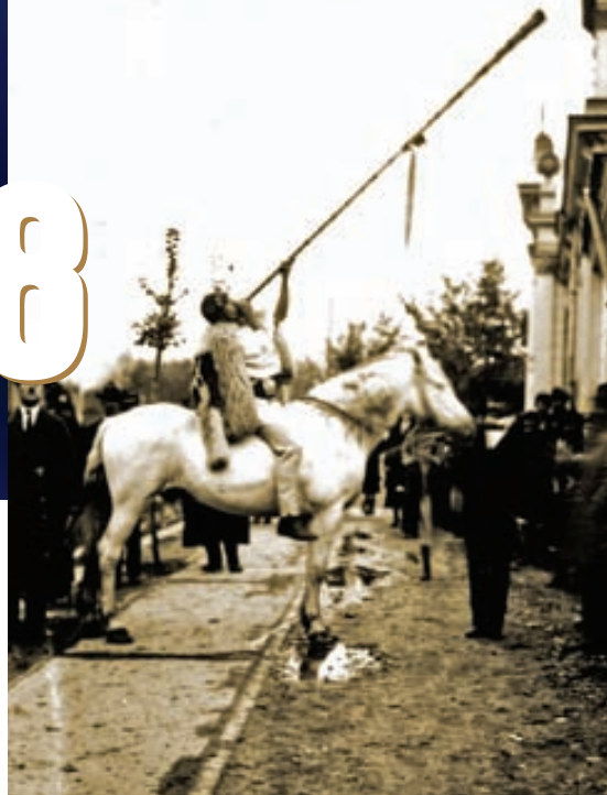
Tulnicul vestește Serbările Încoronării (15-16 octombrie 1922)

Următoarea provincie unită cu România a fost Bucovina. Pierdută în 1774, prin pacea de la Kuciuk-Kainargi, în favoarea Imperiului Habsburgic, acea parte a nordului Moldovei a primit numele Bucovina, din partea viitorului împărat Iosif al II-lea. Deși habsburgii încurajaseră stabilirea în Bucovina a cât mai multor cetățeni de alte etnii, românii rămăseseră majoritari și erau foarte uniți,