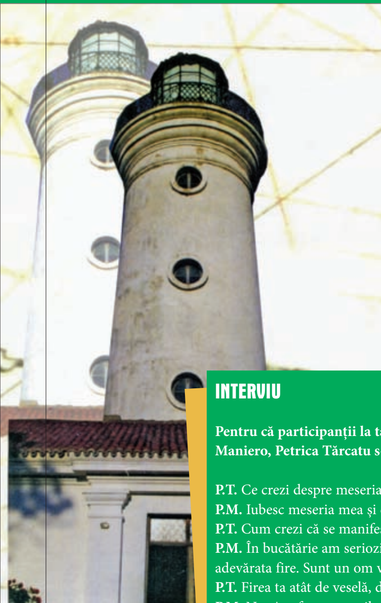
Sulina. Farul Comisiei Europene a Dunării