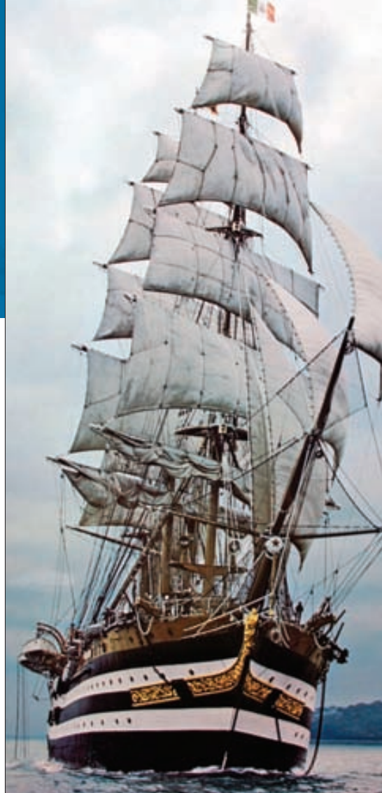
Veliero scuola / Velierul „Amerigo Vespucci”

La grande trasformazione avviene il 17 novembre 1860, con l'unificazione delle Marine sarda, borbonica,