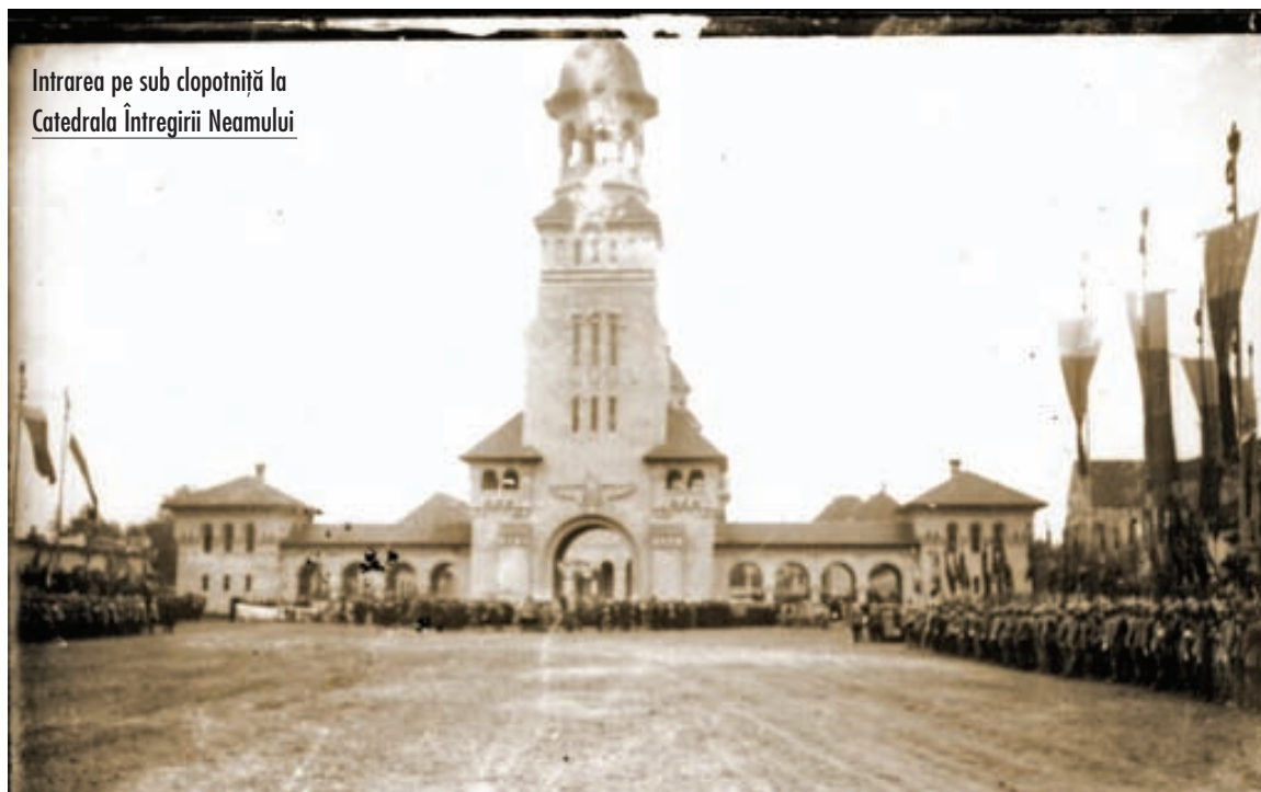
Intrarea pe sub clopotniță la Catedrala Întregirii Neamului

Dopo solo un anno, cominciava la Prima Guerra Mondiale. La Romania ha conservato la sua neutralità nei primi due anni di lotta. Per assicurarsi il diritto alle province abitate dai romeni e che si trovavano oltre i suoi confini, la Romania ha dovuto firmare nel 1914 due trattati, uno con i poteri dell'Antanta - per il quale riceveva il diritto sulle province abitate maggiormente dai romeni e che avevano fatto parte dall'Impero Austro-Ungarico - e uno con l'Italia.