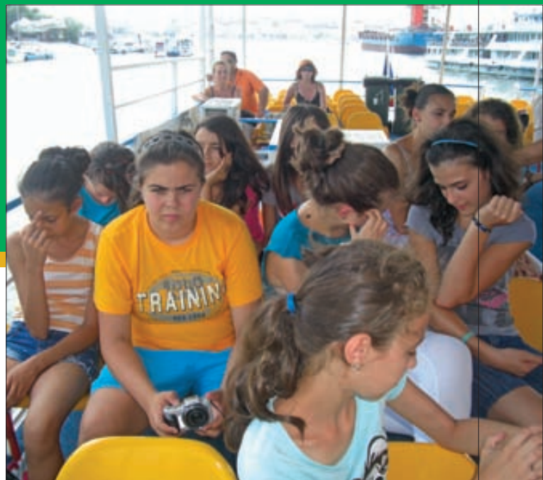
Cu catamaranul Europolis pe brațul Sf. Gheorghe