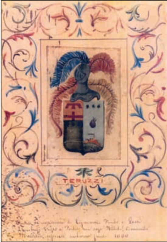
Blazonul familiei Teruzzi