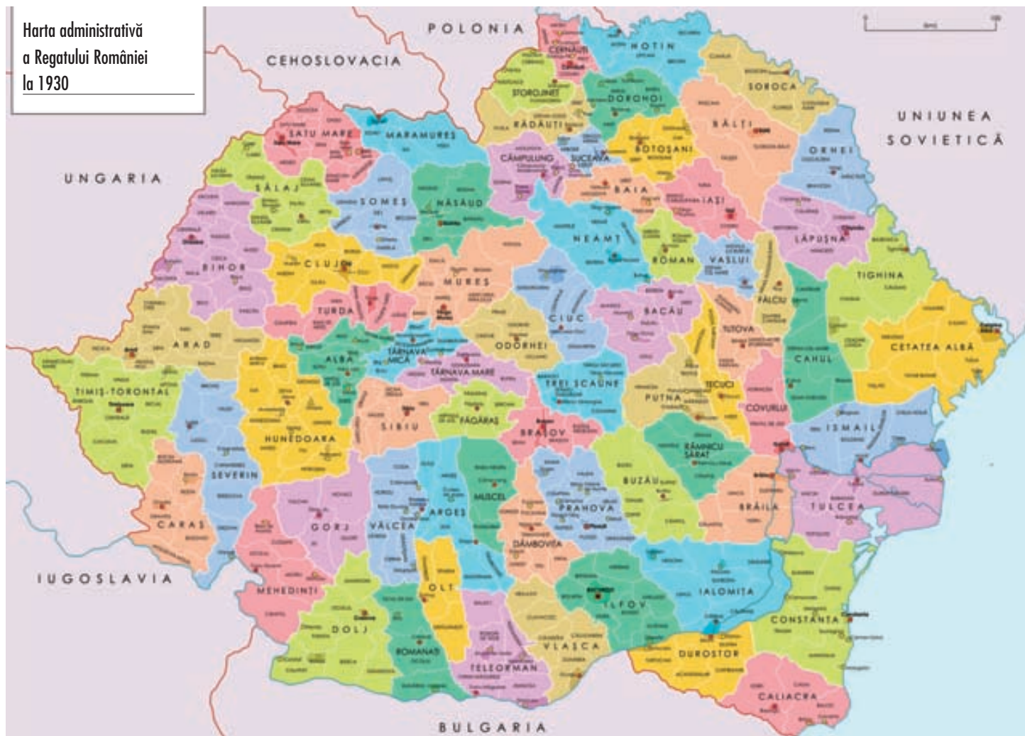
Harta administrativă a Regatului României la 1930

asa că, pe fondul pierderii războiului de către Puterile Centrale și al dezmembrării Imperiului Austro-Ungar, la Cernăuți a luat ființă, în ziua de 27 octombrie 1918, Adunarea Constituantă , care a ales Consiliul Național. Acesta, la Congresul din 28 noiembrie 1918, a votat unirea necondiționată a Bucovinei cu România. De menționat că la congres reprezentarea etnică a fost proporțională (74 delegați români, opt germani, șapte polonezi și 13 ucraineni) și că unirea a fost aprobată în unanimitate.