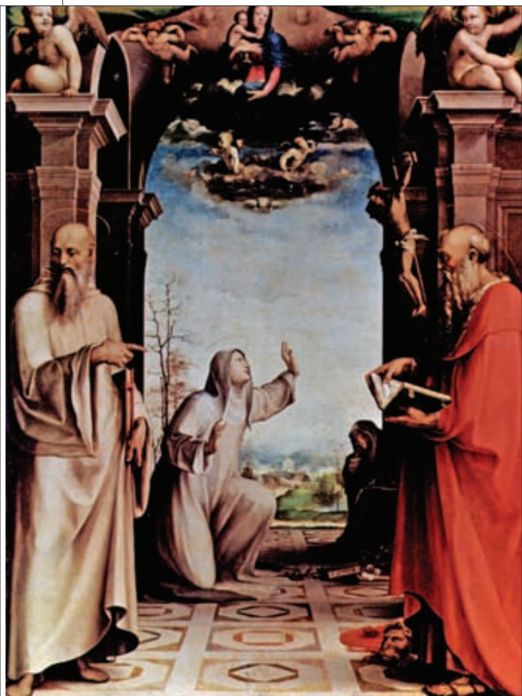
Domenico Beccafumi, Stimate di santa Caterina , circa 1515, Pinacoteca Nazionale – Siena

Însă marea noutate a Caterinei este implicarea ei în viața politică. Intervenise, cu succes, în rânduielile Bisericii, determinându-l pe Papa Gregoriu al XI-lea să se întoarcă de la Avignon la Roma. Într-o Europă sfâșiată de războaie, Caterina scrie (mai bine zis: dictează, căci abia târziu, în mod miraculos, s-a pomenit că mânuiește condeiul, după ce, tot așa, a început să citească) regilor Franței, Angliei, Poloniei, reginei Neapolelui, seniorilor, guvernelor