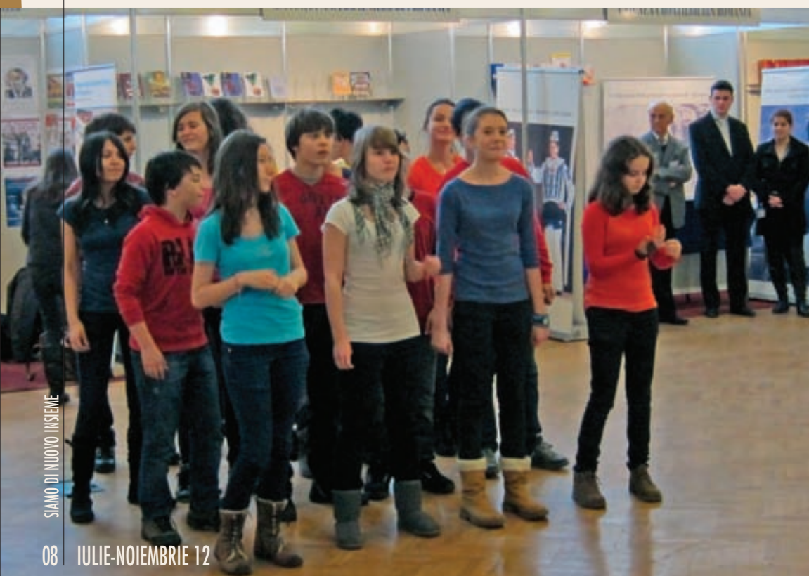
Elevi de la Liceul „Dante Alighieri”, în recital