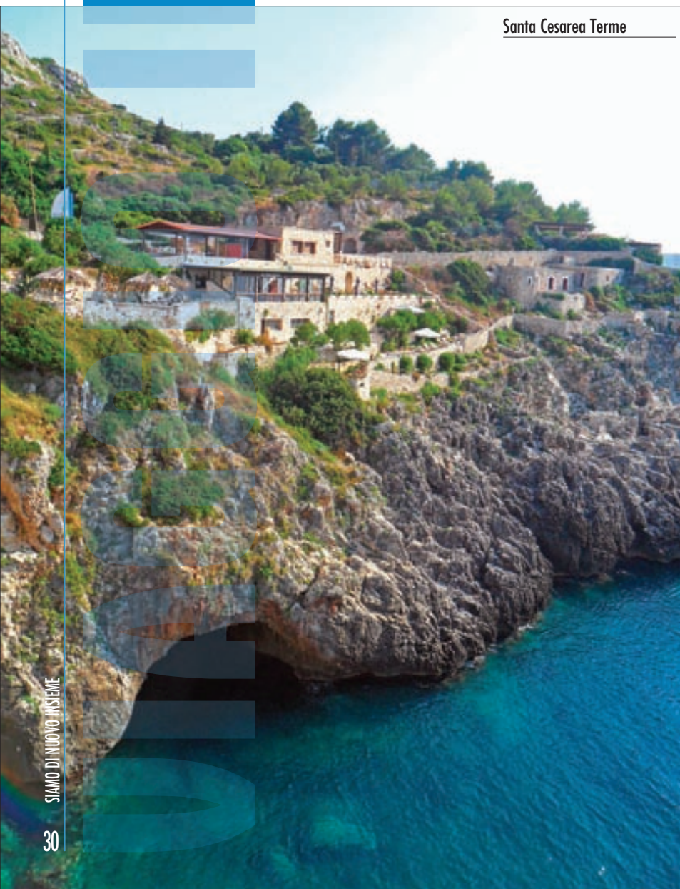
Santa Cesarea Terme

Santa Cesarea Terme seduce il visitatore con l’azzurro più affascinante del Mare Adriatico, con la fascia costiera alta, ripida e frastagliata che nasconde piccole terme e grotte in cui si può entrare solo passando dal mare. Con le foreste secolari di ulivi, con le quattro torri costiere, costruite da Carlo V con il ruolo di difesa, con l’inedito dei suoi monumenti civili e religiosi: Villa Sticchi costruita in stile arabo, Villa Raffaella che ha il nome della baronessa di cui era la residenza estiva, e dove oggi si trova lo stabilimento termale dove tutti possono beneficiare delle qualità terapeutiche dell’acqua ricca di iodio, zolfo e cloro, il Museo del Mare, il Museo degli Orologi delle Torri civiche, la Chiesa della “Madre del Sacro Cuore” dove si dice che morì una Vergine Cesaria la cui statua in cartapesta si trova nella Chiesa.