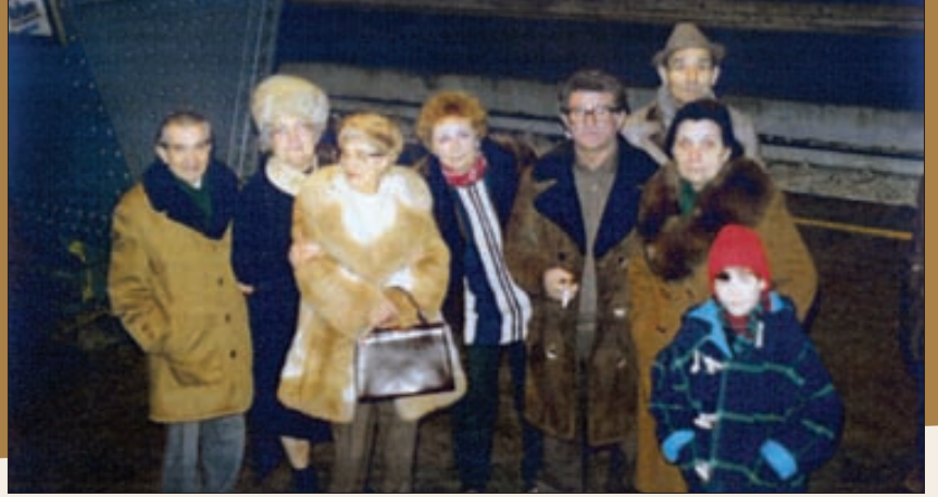
Italia. Întâlnire verilor