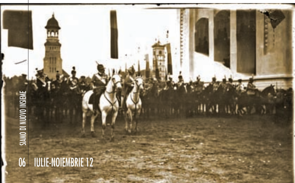
Alba Iulia. Regele Ferdinand și Regina Maria deschid parada militară de după Încoronare

Cronologicamente, gli ultimi territori romeni uniti alla Romania sono stati: la Transilvania, il Banato, la Crisceana ed il Maramures. Nella situazione dello sfacimento dell'Impero Austro-Ungarico, queste